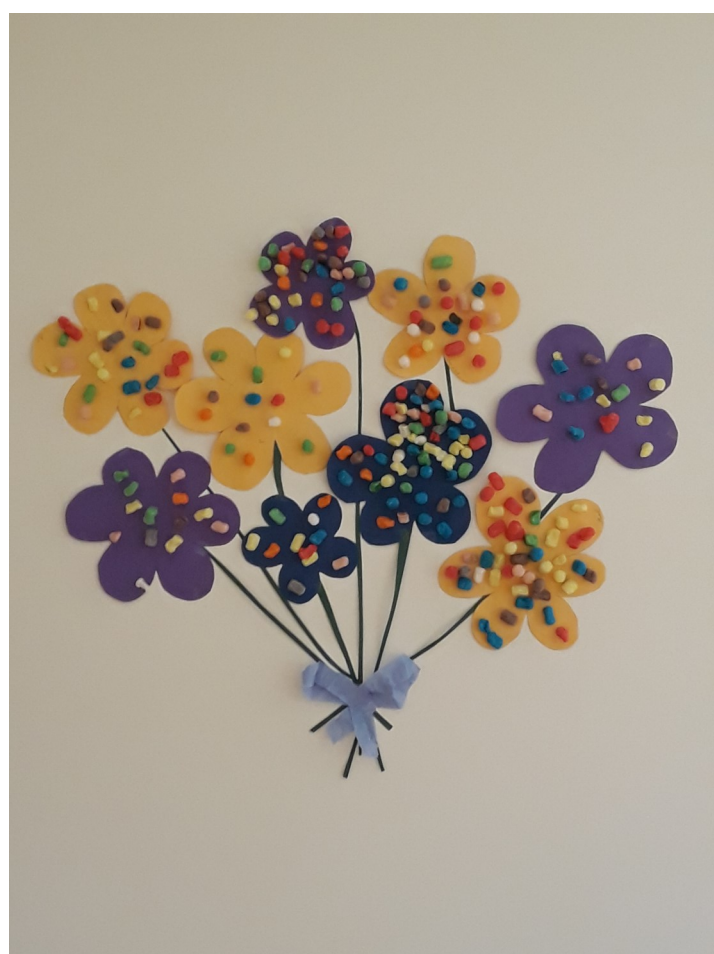
Fleurs en playmaïs

Les après-midi sont consacrés à l'accueil administratif, téléphonique et aux visites.